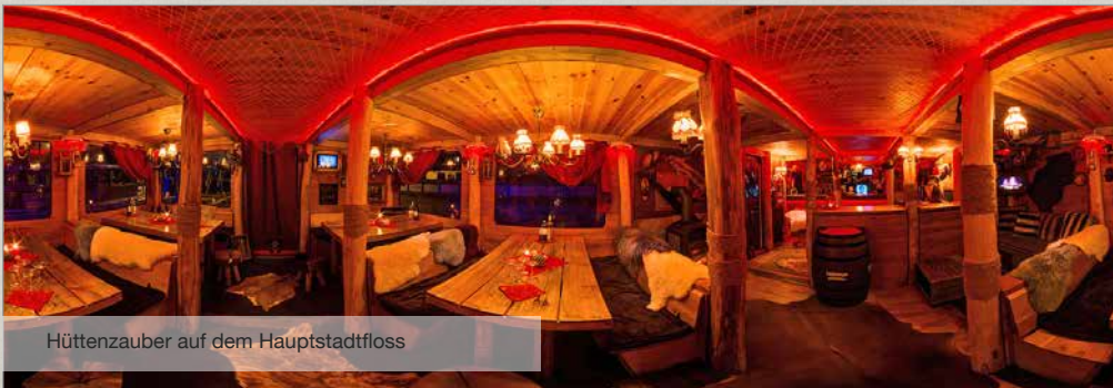
Hüttenzauber auf dem Hauptstadtfloss

Der Preis versteht sich netto zuzüglich der gesetzlichen Mehrwertsteuer und bezieht sich auf eine Mindestbestellmenge für 15 Personen.