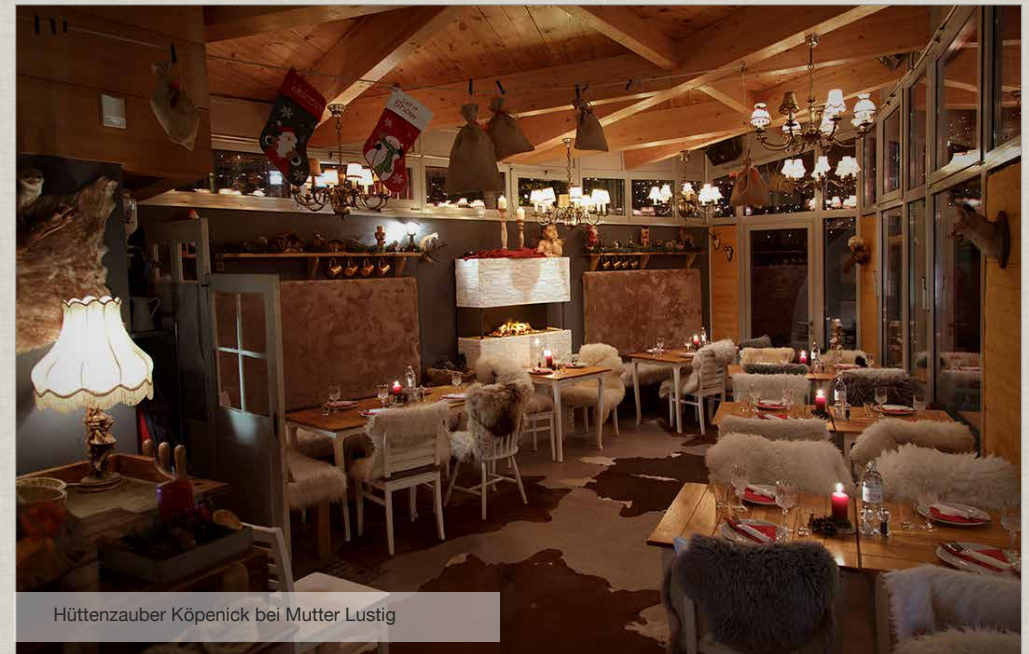
Hüttenzauber Köpenick bei Mutter Lustig

GEBACKENE ENTENKEULE aus dem Rohr mit würzigem Rotkraut, Grünkohl und kräftiger Orangen- Jus, dazu servieren wir knusprige Serviettenknödel und Kartoffelklöße